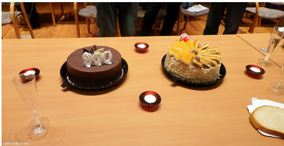
8. ábra. A 900. előadóülést követő ünnepség