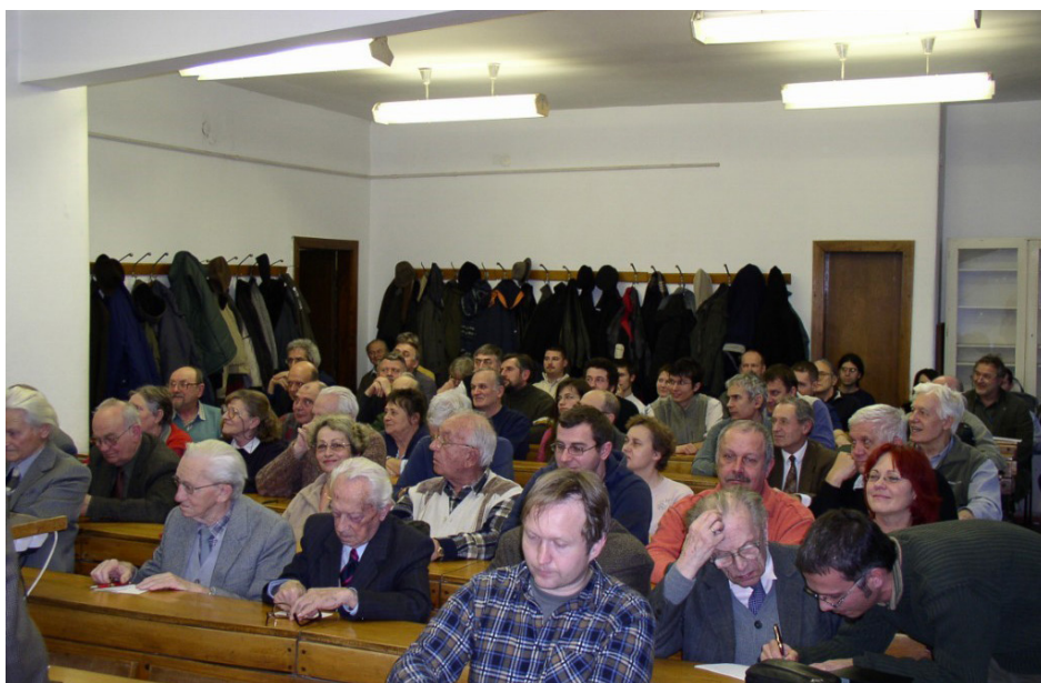
3. ábra. Az MRT 754. ülése, egyben Közgyűlése a Kertészeti Egyetem A4-es előadójában (2007.02.16.)