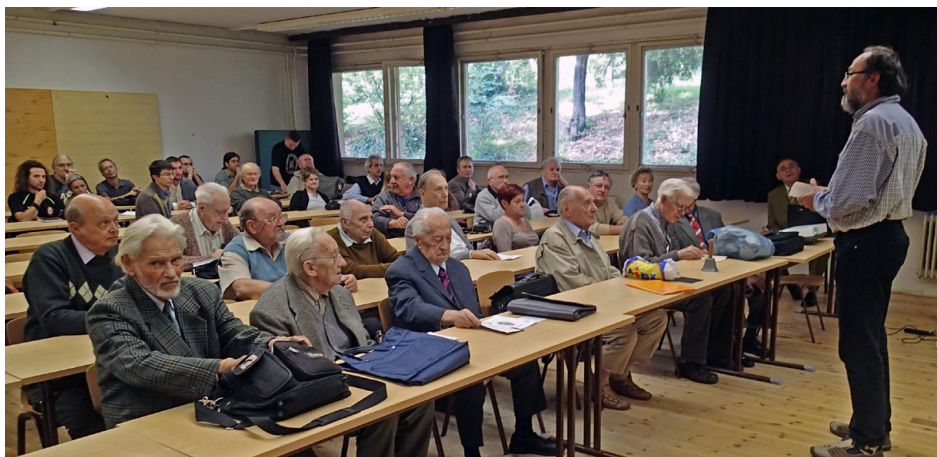
2. ábra. Felvétel a Magyar Rovartani Társaság 809. előadójáról (Kertészeti Egyetem, E2-es előadó, 2013.09.20.)