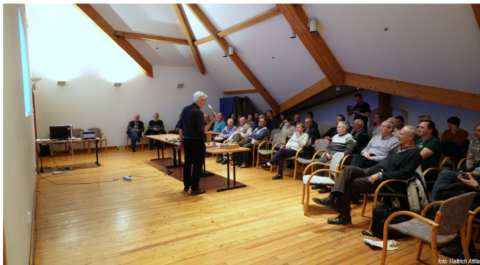
7. ábra. Kép a 900. előadóülésről

Végül eljutottunk a 900. előadóülésünkig, amelyre 2023. december 15-én került sor az MTM Ludovika téri épületnek tetőtéri előadó-jában. Az előadások után – ahol többek között az itt ismertetett képeket és adatokat is bemutattam – jubileumi ünnepségre került sor, ahol pezsgővel és tortákkal egészítettük ki a megszokott lilahagymás zsíroskenyér-vacsorát (7–9. ábrák).