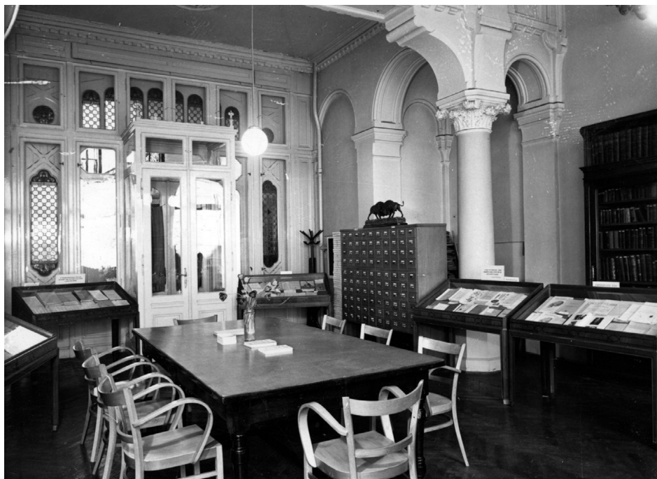
1. ábra. Az MTM Állattár könyvtárának olvasóterme, ahol a '40-es évek végétől az 1956-os forradalom kitöréséig zajlottak az előadóülések

Ugyancsak érdekes nyomon követni az előadóülések helyszínét, amely a meghívókon szintén pontosan fel van tüntetve. Ezek közül a legfontosabbak, a teljesség igénye nélkül: a Magyar Természettudományi Múzeum (MTM) Állattárának könyvtári olvasóterme (1. ábra), az ELTE Állatrendszertani Intézetének állattani előadója, a Magyar Nemzeti Múzeum emeleti előadóterme, a KÉE, azaz Kertészeti Egyetem (ma MATE Budai Campusa) előadói (2–3. ábrák) és végül, 2021 szeptemberétől ismét az MTM, de most a Ludovika téri épület Semsey Andor Előadóterme (4. ábra)