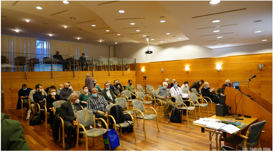
4. ábra. Rovartani ülés járvány idején a Semsey Andor Előadóteremben (2021.11.19.)

A következő táblázattal (1. táblázat), melyet a meghívókon szereplő adatok alapján készítettem, átláthatóbbá szerettem volna tenni, hogy helyszínenként hány előadóülést tartottunk a második világháború után. Csak a fontosabb helyszínek kerültek felsorolásra, a számok pedig az ott tartott előadóülésekre vonatkoznak.