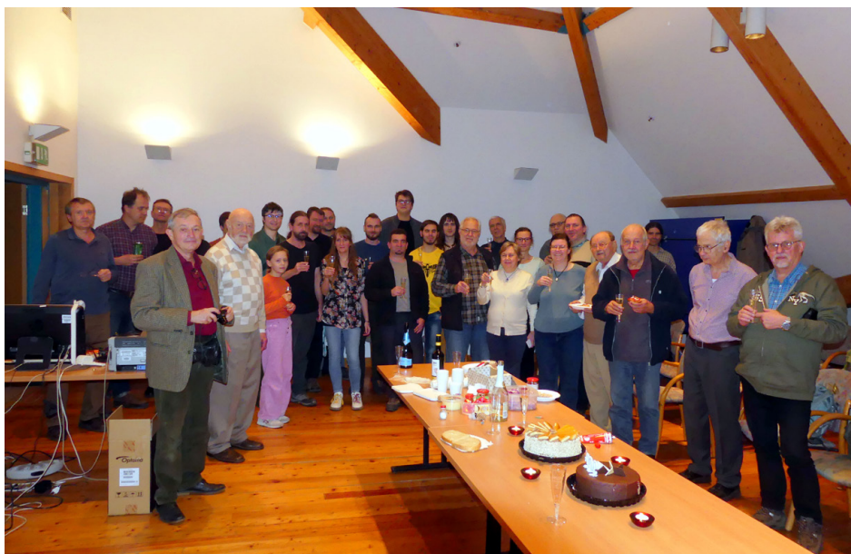
9. ábra. A 900. előadóülés résztvevőinek csoportképe